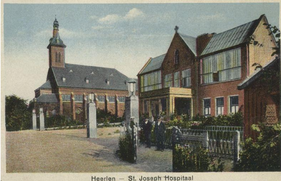
Heerlen — St. Joseph Hospitaal

mogelijkheden van gewapend beton. Op medisch gebied, in de geologie en in het onderwijs werd een grote sprong voorwaarts gerealiseerd. De open sfeer voor nieuwe mogelijkheden vond ook zijn weerslag in de amusementswereld en de literatuur. De Mijnstreek werd modern en op veel gebieden toonaangevend. Deze lezing is een samenwerkingsproject tussen Gilde Landgraaf en LGOG Parkstad.